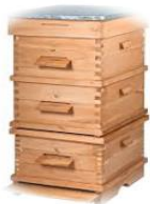
Caja para colmena