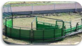
Corral de manejo