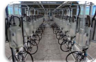
Sala de ordeña